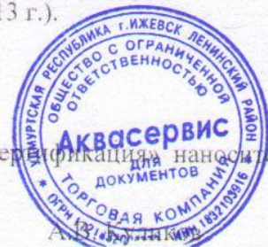
Схема сертификации – За

Знак соответствия по ГОСТ Р 50460 с надписью «Добровольная сертификация» наносится в сопроводительной технической документации.